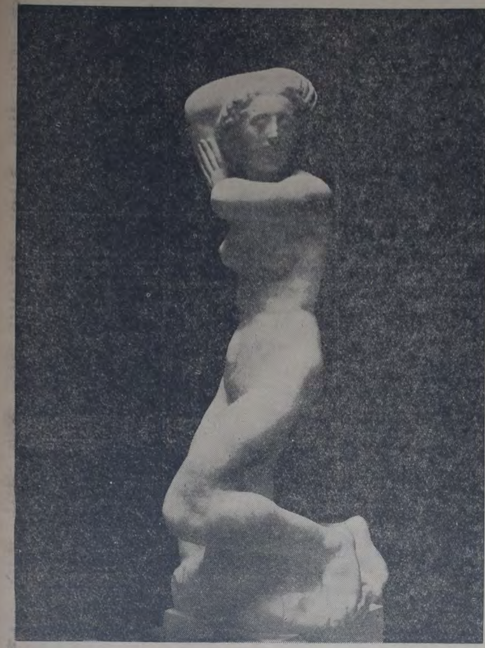
ANTON HANAK — "La muchacha"