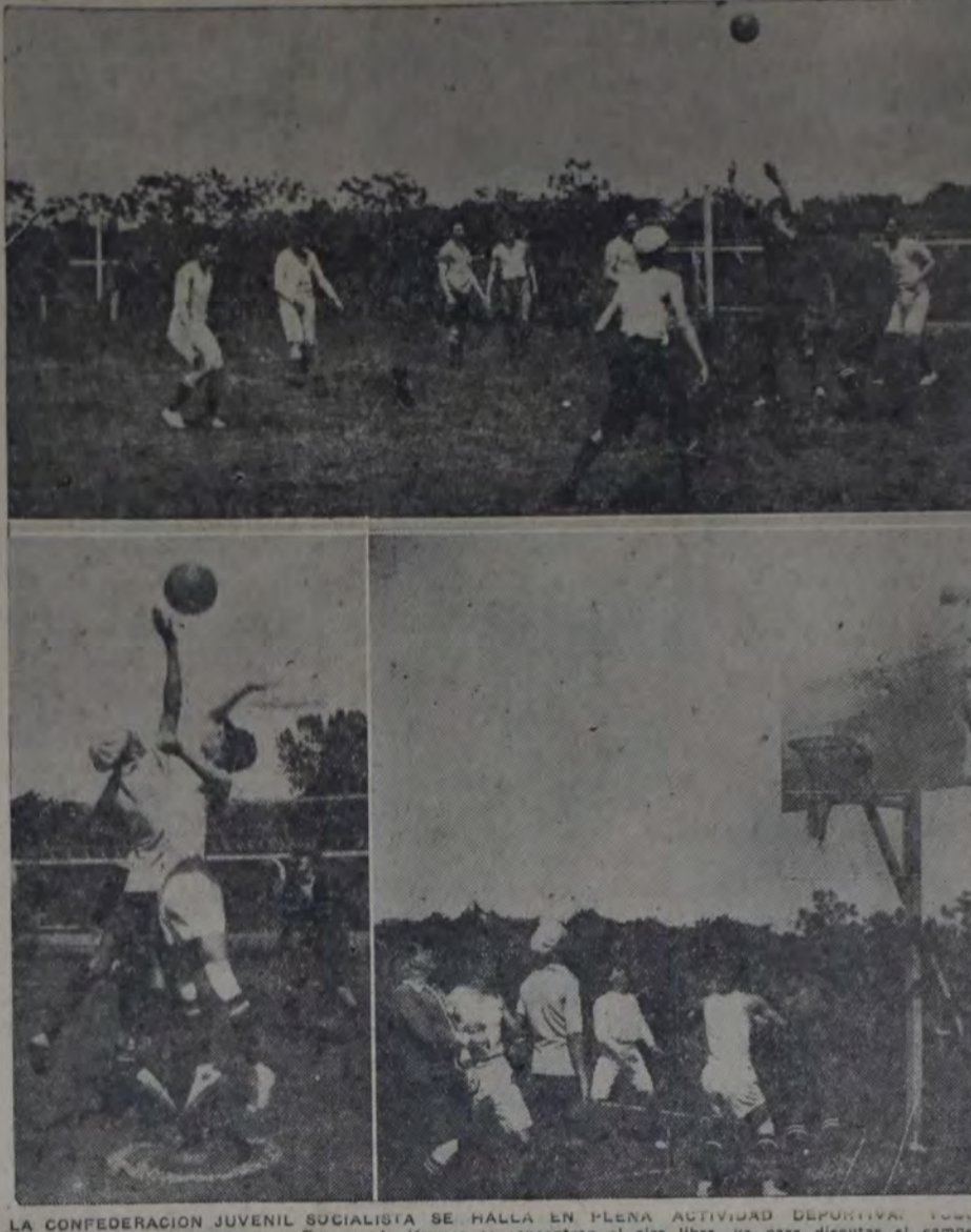
LA CONFEDERACION JUVENIL SOCIALISTA SE HALLA EN PLENA ACTIVIDAD DEPORTIVA. En los domingos y días festivos, centenares de jóvenes se concentran al aire libre, ya para disputar el campeonato de fútbol o encuentros amistosos de basketbol. Las fotografías que publicamos muestran tres vistas de partidos de basketbol, deporte que se va imponiendo en la Confederación Juvenil Socialista.