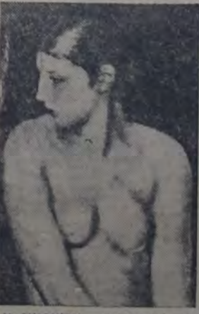
M. SIMONIDY — "Buste de jeune fille"

Decir que es clásico sería incurrir en un error de estimación, siendo que si bien tiene como los ma-